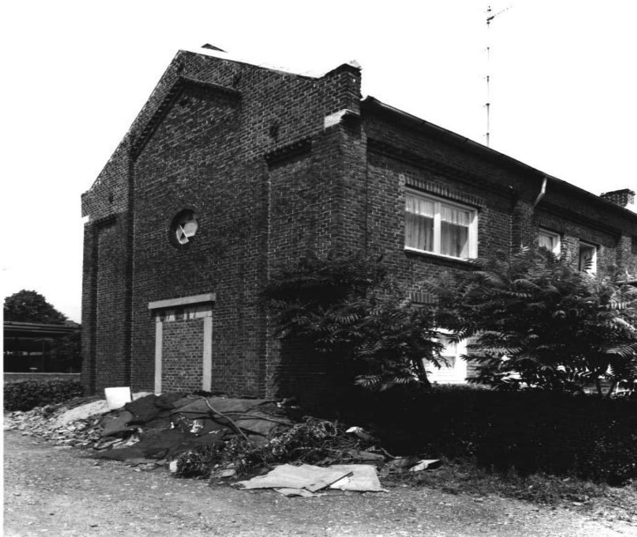
De synagoge van Beek uit 1866 werd in 1954 verbouwd tot een woonhuis, 1967

Van het twintigtal joden dat aan het begin van de Duitse bezetting in Beek woonde hebben zich twaalf het leven weten te redden door onder te duiken. De overigen zijn gedeporteerd en in de concentratiekampen omgekomen.